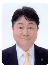
稲城市長 高橋 勝浩