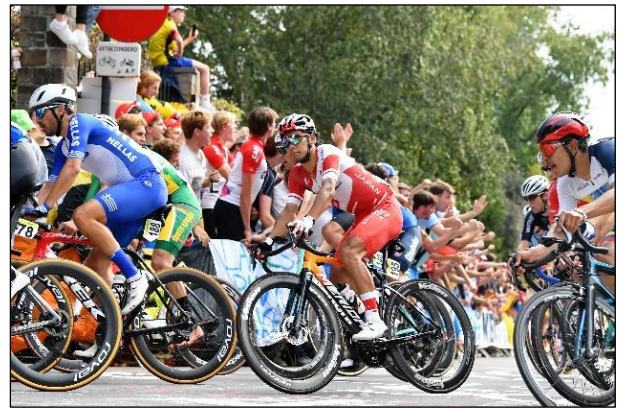
ロードレースイメージ