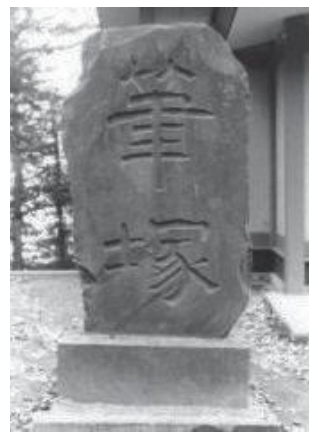
穴澤天神社の筆塚（稲城市指定文化財）

編集・発行 稲城市教育委員会教育部生涯学習課 〒206-8601 稲城市東長沼2111 ☎042-377-2121 042-379-0491