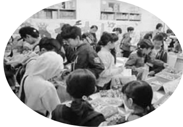
▲楽しい児童館まつり(昨年度)

城山文化センターを拠点に活動しているグループが「まつり実行委員会」を組織し、展示・ステージ発表会・模擬店など、楽しさいっぱいの催しを行います。また、城山児童館まつりは11月17日(日)に開催いたします。〔11月16日(土)は写真展示のみ〕ご近所の方やお友達をお誘いあわせのうえ、ぜひお出かけください。