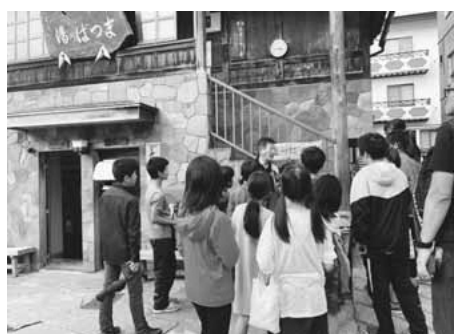
▲温泉街散策の様子

温泉街散策の時間には、家族や自分へのお土産を買ったり野沢温泉村名物を購入して食べたりにしている子供もいれば、野沢温泉村にある「外湯」をすべて制覇するために村中を回っている子供もいました。きっと、一番楽しみにしていた時間であり、一番楽しく素敵なお出がけできた時間だったのでないでしょうか。夜は、民宿の方からは、野沢温泉村に伝わる文化や伝統、村の人々とのつながりの深さについて学び、子供たちは稲城の自然や町並み、特産物などについて民宿の方に紹介しました。また、野沢温泉村で行われる有名な「道祖神祭り」についてもお話をいただきました。