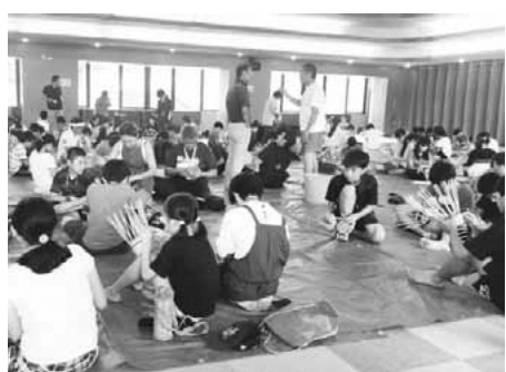
▲つる細工体験の様子

また、野沢温泉村に古くから受け継がれている伝統工芸「つる細工」体験もさせていただきました。