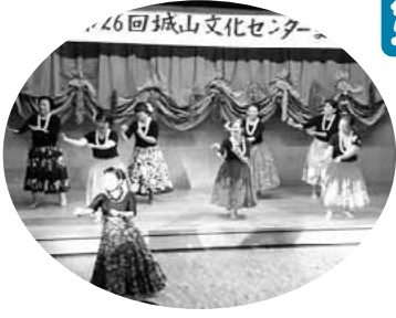
▲練習の成果をステージで(昨年度)

市民ギャラリーのご案内 ▼期日・出展者 11月1日(金) ▼会場 市役所1階ロビー ▼問合せ 稲城市芸術文化団体連合会 11月5日(火)~11月29日(金) YUKIKO(アクリル画)