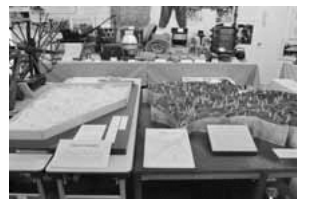
▲平尾と坂浜の地形模型

坂浜地域の地形模型は、多摩ニュータウンの造成工事が始まる前の地形の様子を復元した模型です。明治10年と昭和15年の民家地図を元に、等高線に沿って紙粘土を貼り付けて地形をつくり、全体を着色したうえで、点在する集落、河川と旧道、昔の字名や地名などが復元されています。多摩丘陵と谷戸地形を中心