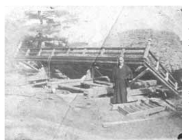
倒壊した常楽寺の門

ほとんどはありませんが、全壊家屋178棟、半壊家屋276棟、死者3名という状況でした。村内の寺院や神社の建物も多くが被害をうけ、常楽寺(東長沼)、円照寺(大丸)、杉山神社(平尾)、天満神社(坂浜)などの建物が倒壊しています。また小学校の校舎や村内の道路・橋も大きな被害を受けました。