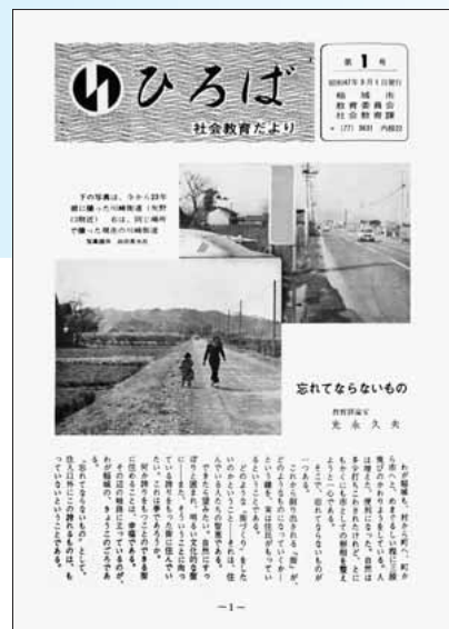
▲生涯学習だよりひろば創刊号

これからも、稲城市の生涯学習情報を市民の皆様にお伝えしてまいりますので、今後とも生涯学習だより「ひろば」をよろしくお願いいたします。