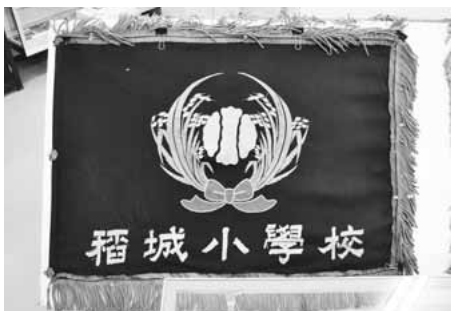
▲稲城小學校の校旗

大丸の円照寺東南側に明治30年に開設された大丸尋常小学校の校旗です。昭和初期に稲城尋常小学校の分校になったことから稲城第一小学校で保存されることになりました。