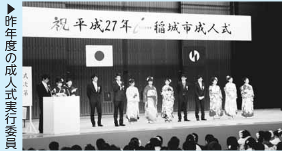
▶ 昨年度の成人式実行委員

新成人の皆さん、成人式を自分たちの手で企画・運営してみませんか。チャレンジ精神あふれる方の参加をお待ちしています。 ▷対象 平成7年4月2日～平成8年4月1日生まれの市内在住者 ▷定員 10人程度 ▷申込期限 7月15日(水)までに電話で応募してください。 ▷問合せ 生涯学習課