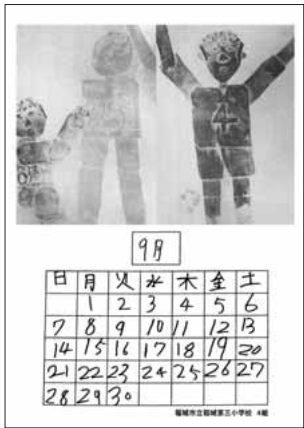
稲城市立稲城第三小学校4組の皆さんの作品です。

編集・発行 稲城市教育委員会教育部生涯学習課 〒206-8601 稲城市東長沼2111 ☎042-377-2121 042-379-0491