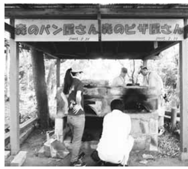
▲オリジナルピザを作ろう!

稲城ふれあいの森で自然を満喫しながら、ゲームをしたり、ピザを作ってみよう。 ▽期日 10月19日(日)(雨天中止) ▽時間 午前9時～午後2時半 ▽集合・解散場所 京王線若葉台駅改札前 ▽活動場所 稲城ふれあいの森