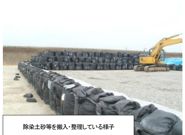
除染土砂等を搬入・整理している様子