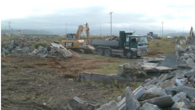
家屋基礎コンクリート取壊・運搬の様子