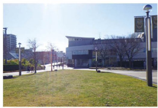
若葉台(多摩ニュータウン)