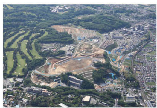
南山東部地区(区画整理)