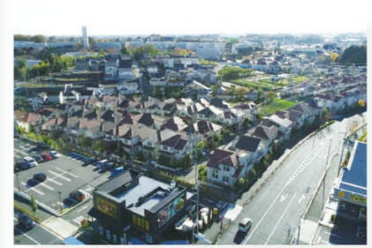
上平尾地区(区画整理)