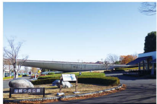
稲城中央公園(くじら橋)