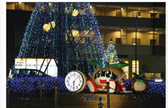
JR矢野口駅前広場(イルミネーション)