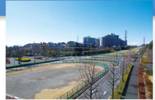
多3・1・6号 南多摩尾根幹線